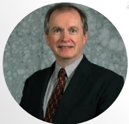
D. A. Carson

Viveremos na tensão de reivindicar cada centímetro quadrado para o rei Jesus, embora saibamos muito bem que a consumação ainda não chegou, que andamos pela fé e não pelo que vemos e que as armas com as quais lutamos não são as armas do mundo.”