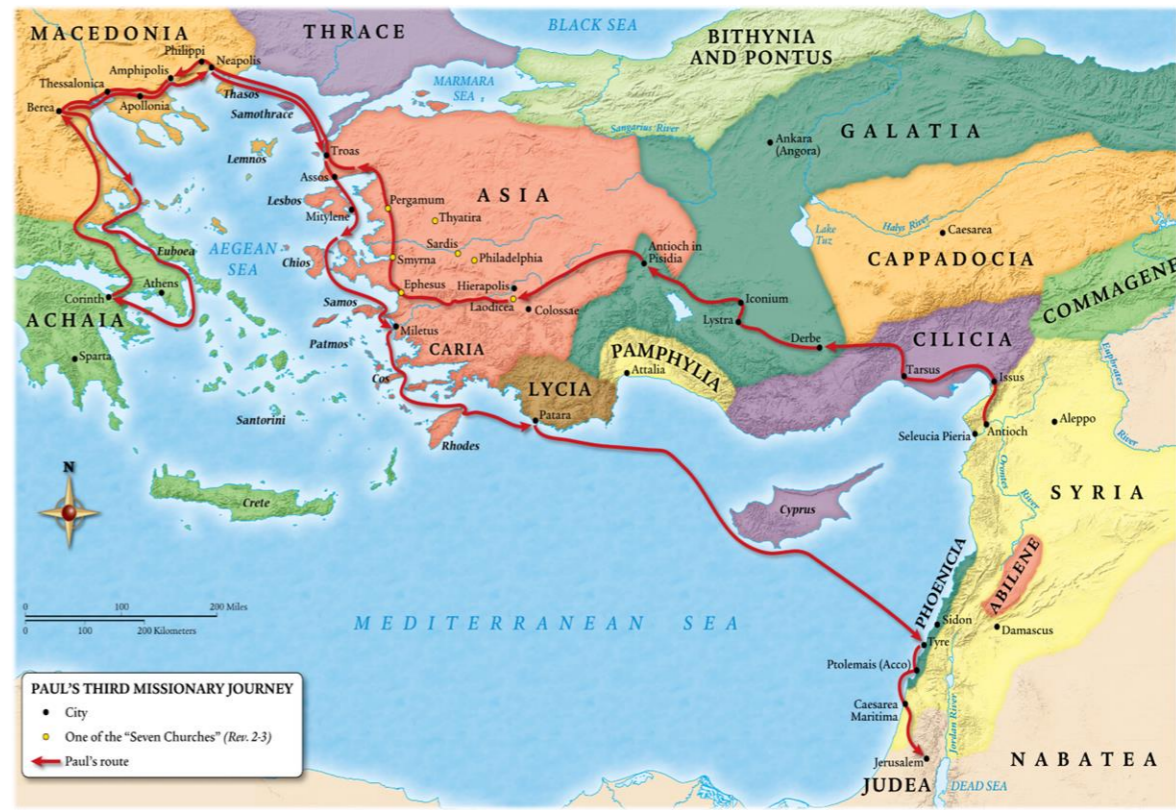
3ª viagem missionária de Paulo

A eternidade após a restauração de todas as coisas (Apocalipse 21)