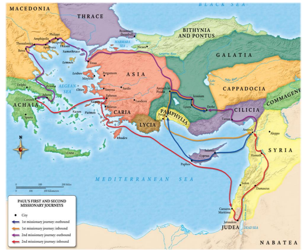
1ª e 2ª viagem missionária de Paulo

Os filósofos gregos pré-socráticos Tales de Mileto (624 a.C. - 558 a.C.) Anaximandro (610 a.C. - 546 a.C.) Pitágoras (582 a.C. - 497 a.C.) Heráclito (540 a.C. - 470 a.C.) Parmênides (510 a.C. - 445 a.C.) Demócrito (460 a.C. - 370 a.C.) Os filósofos gregos socráticos Sócrates (469 a.C. - 399 a.C.) Platão (427 a.C. - 347 a.C.) Aristóteles (384 a.C. - 322 a.C.) Os filósofos da época helenista Epicuro (341 a.C. - 271 a.C.) Zenão de Cítio (333 a.C. - 263 a.C.) Pirro de Élide (360 a.C. - 270 a.C.)